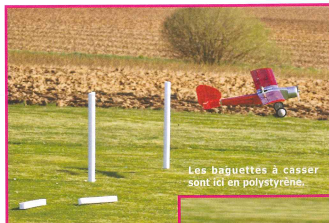
Les baguettes à casser sont ici en polystyrène.

Contrairement à leurs confrères français, les "Baronistes" belges ne semblent pas rechigner à lancer des modèles RTF dans la bataille !