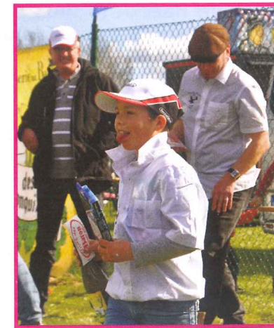
Toutes les générations se retrouvent avec plaisir autour de ces rencontres conviviales que sont les "Coupes des Barons"... A quand une Coupe d'Europe ?