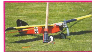
Les blessures sont pansées à grands renforts de scotch !